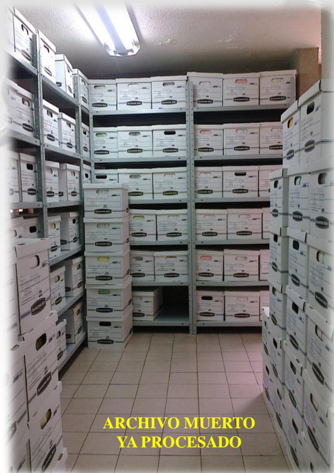
ARCHIVO MUERTO YA PROCESADO