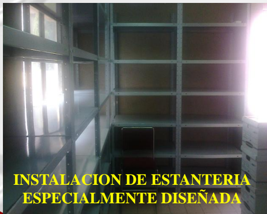
INSTALACION DE ESTANTERIA ESPECIALMENTE DISEÑADA