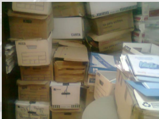
ARCHIVO MUERTO SIN ORGANIZAR